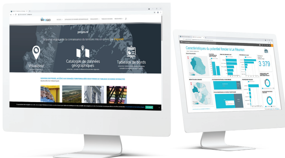
■ Illustration de la plateforme www.peigeo.re